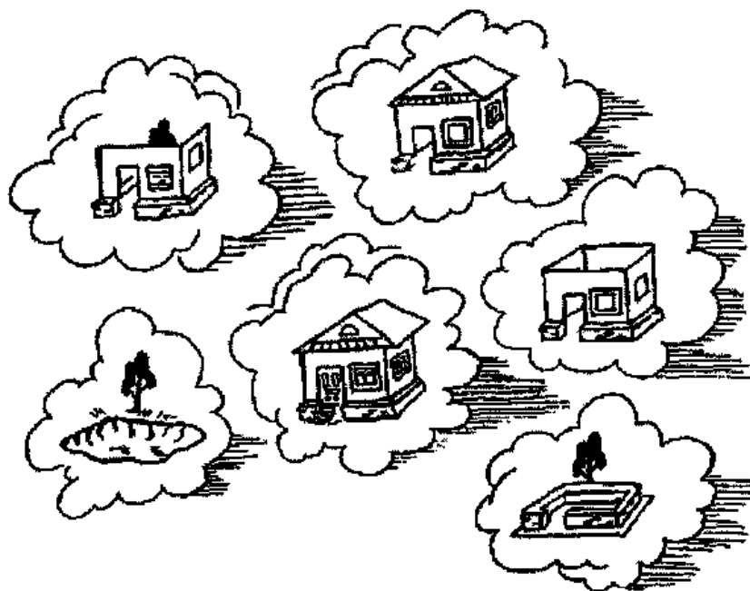
Рис. 75. С помощью стрелок покажи последовательность строительства дома.

Вырежи картинки, положи их в правильной последовательности «от самого младшего к самому старшему возрасту». Ответь на вопросы: сколько тебе лет? Покажи на картинке, кто твой ровесник?