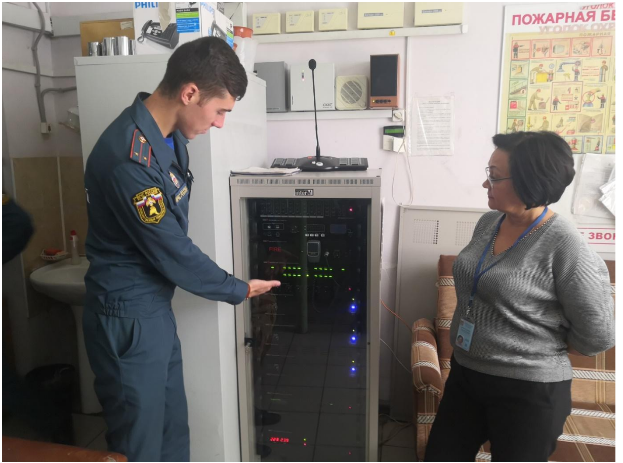
ОНДПР Центрального района 18.10.2019