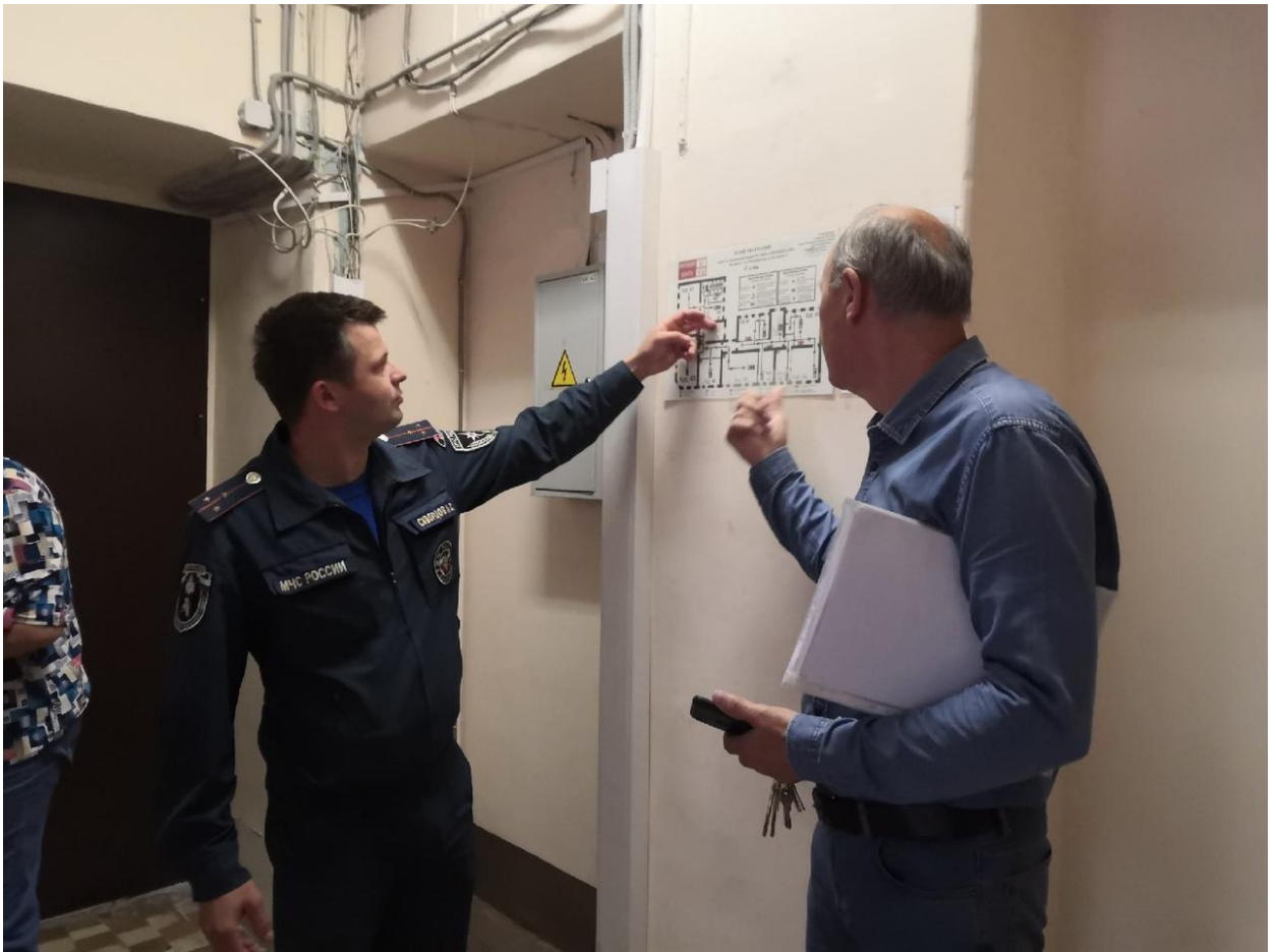
Управление по Центральному району 20.07.2020