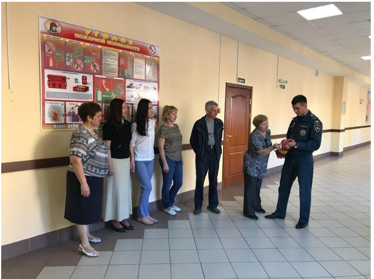
ОНДПР Центрального района 29.05.2018г.